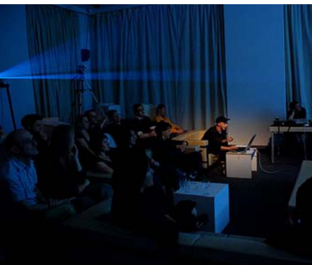
Lecture @ Medienkunsthaus Tesla 2007