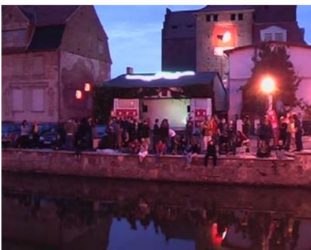
triPhaze: Musik für Fische, Garage Festival 2004

Nachtmusik für Fische – Garage zeigte Weltpremiere