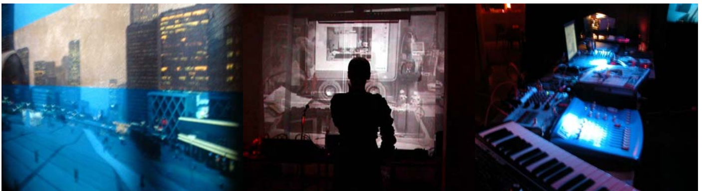
triPhaze/ privatelektro visuals and live setup