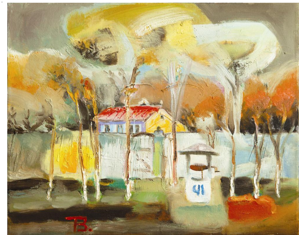
↑ Casă din Ialoveni Ulei pe pânză 600 × 750 mm 2013