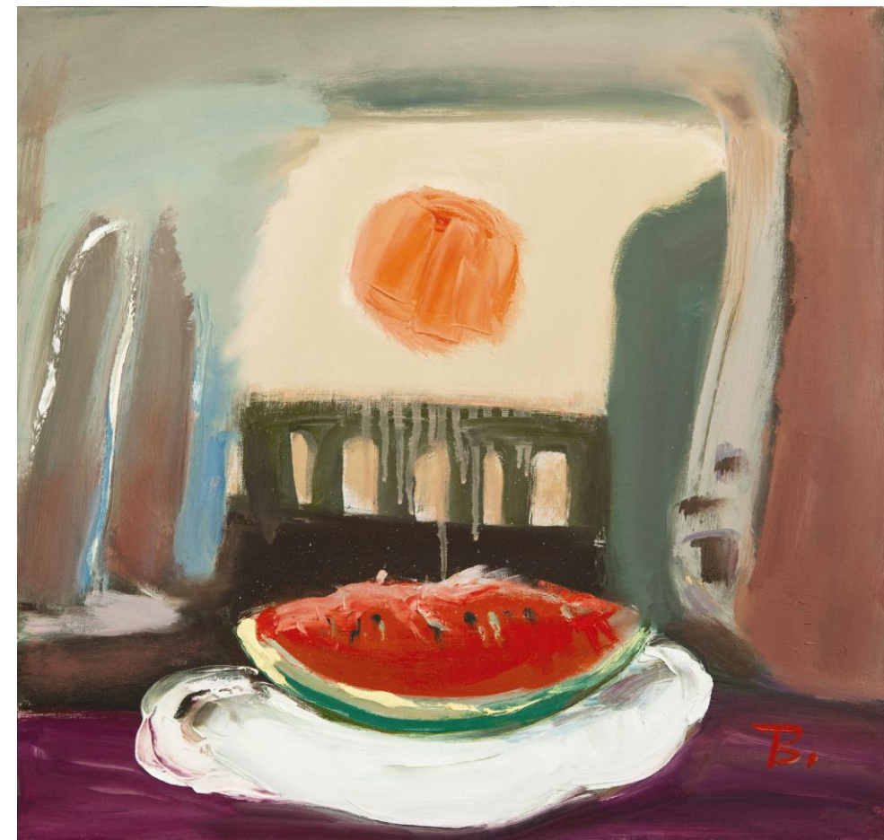
↓ Fie de harbuz, Ulei pe pânză 500 × 520 mm 2013