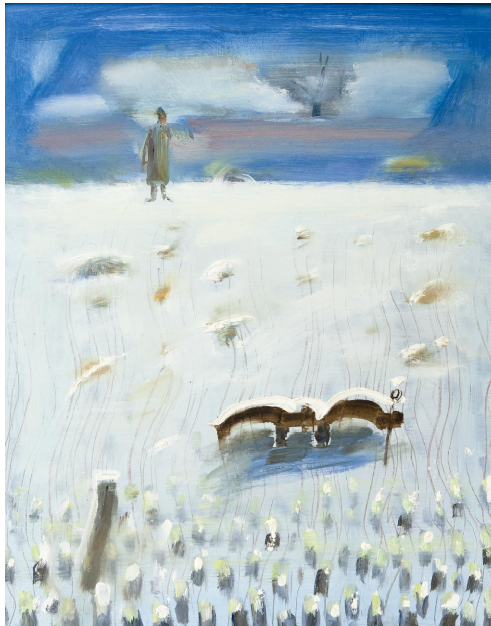
↓ Jug în zăpadă, ulei pe pânză, 500 × 400 mm, 2014